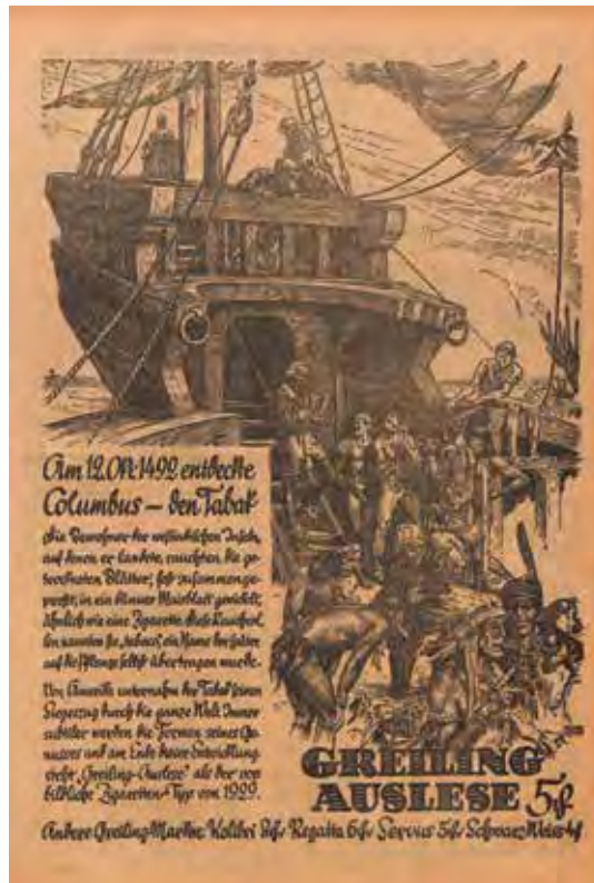
Abb. 5: Tabakwerbung im Vorwärts vom 15.06.1929

gegenwärtigen Zeitpunkt noch per Hand eingegeben werden, was sich jedoch voraussichtlich in der nächsten BCS2-Version ändern wird. In der Praxis hat sich gezeigt, dass es ca. 1 Stunde Arbeit kostet, 100 Ausgaben mit insgesamt ca. 1000 Zeitungsseiten auf diese Weise in BCS-Professional zu importieren. Die OCR-Verarbeitung findet dann per Batch-Operation mittels einer in BCS2-Professional integrierten ABBYY-Finereader-Version für Frakturschrift 9 statt. Diese kostenpflichtige Lösung zeigte im Vergleich zur kostenlosen Tesseract-OCR deutlich bessere Er-