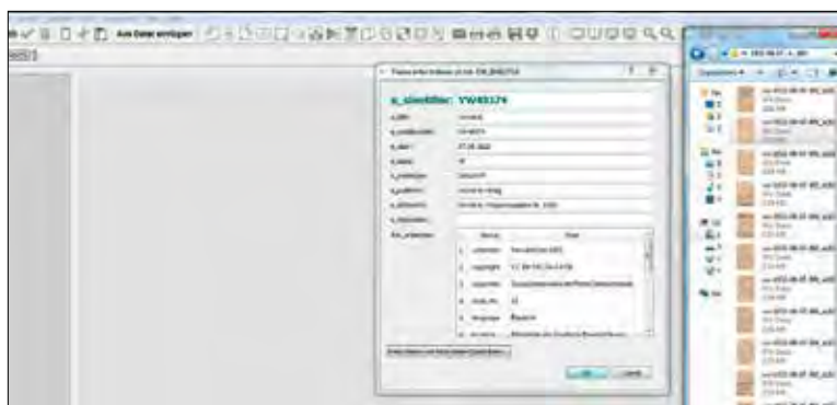
Abb. 1-3: Vorwärts-Ausgabe vom 07.08.1932 beim Import in BCS2

Ergebnis dieses mittlerweile etablierten Workflows