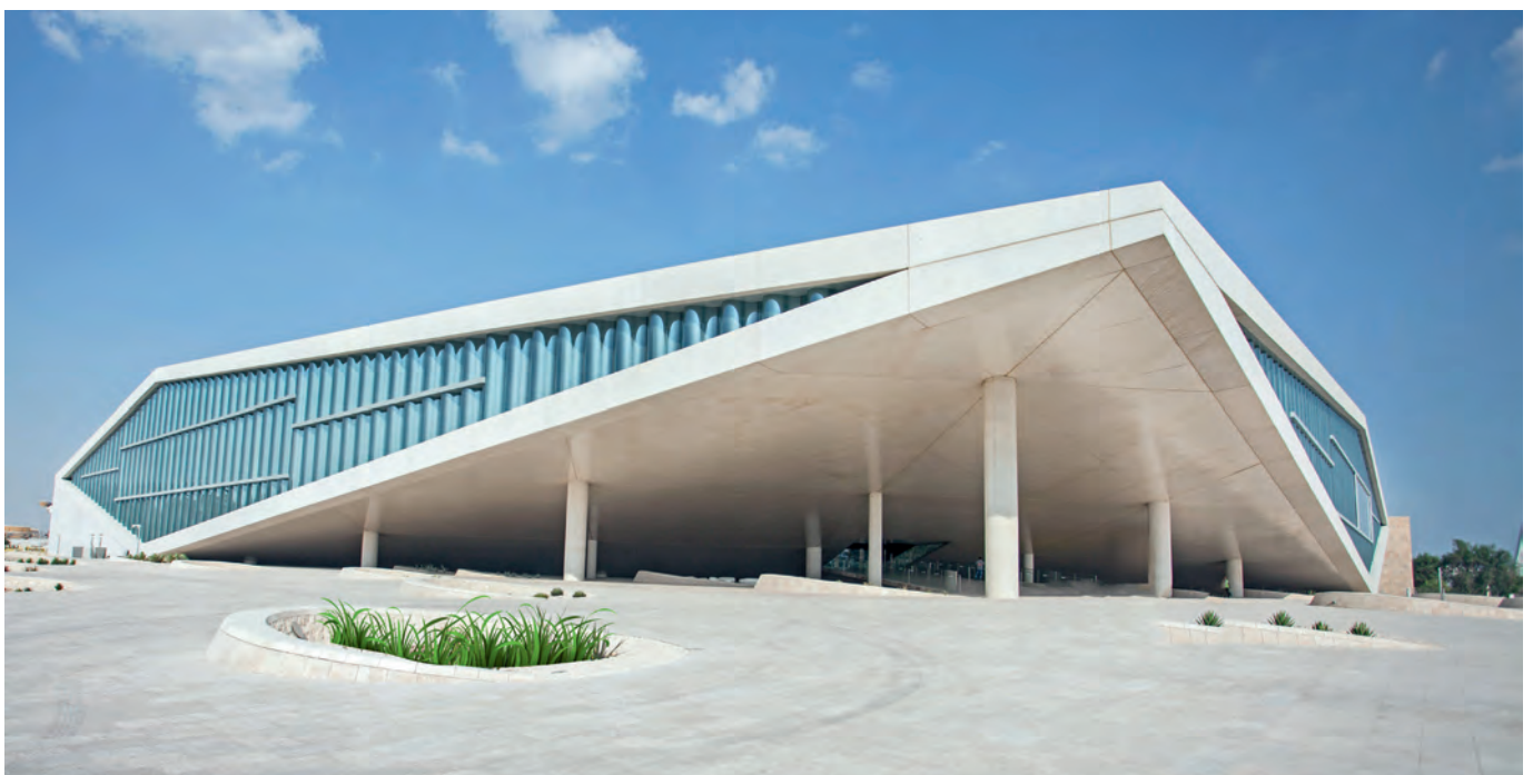
Gigantisches Ausmaß. Die von Rem Koolhaas gestaltete Nationalbibliothek ist mehrere Fußballfelder groß.