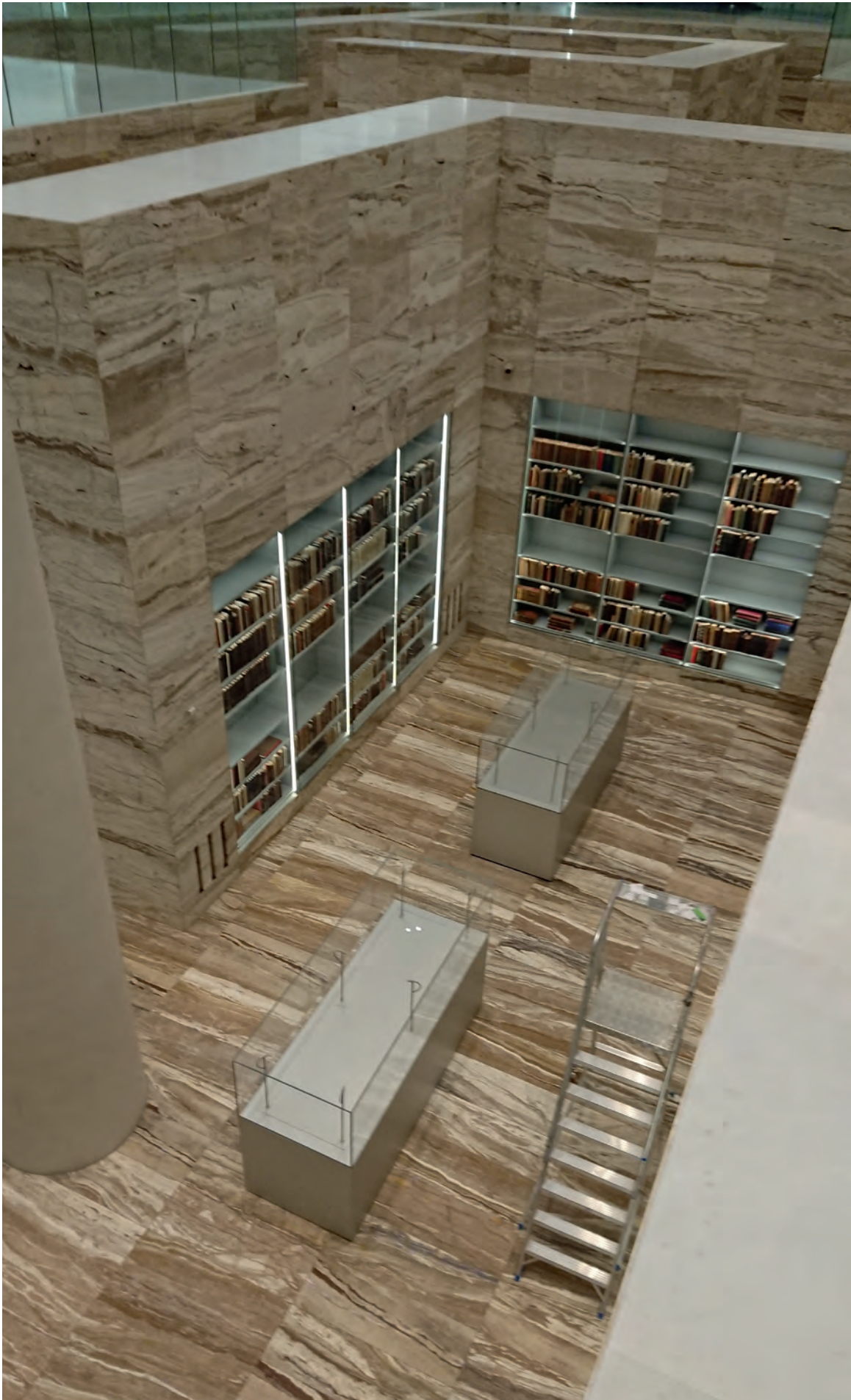
Einer Ausgrabungsstätte ähnlich. Die historische Sammlung ist in den Boden eingelassen.