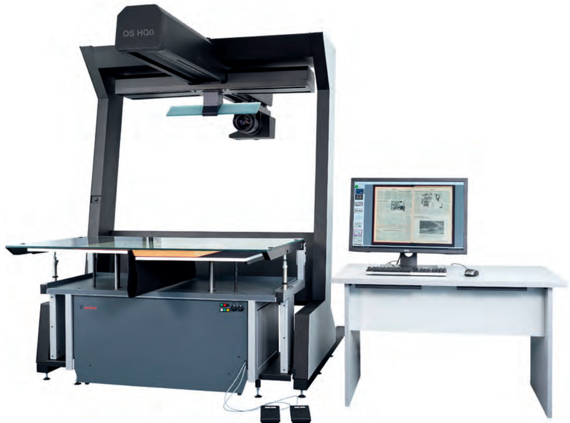
Zeutschel OS HQ_Front mit Computer Kopie.jpg: Der OS HQ ist das neue Scanner-Flaggschiff von Zeutschel für die Digitalisierung großer Vorlagen.

Ein perfektes Bild benötigt eine perfekte Beleuchtung. Hier überzeugt der OS HQ mit einem LED-Beleuchtungssystem der neuesten Generation. Dieses bietet eine homogene Beleuchtung und gleichmäßige Helligkeit auf Tageslichtniveau im gesamten Scanbereich. In Verbindung mit einer speziellen Lichtführung werden auf diese Weise Reflexe auf glänzenden