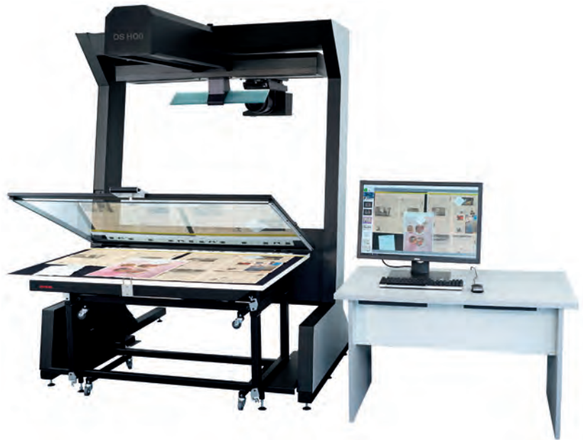
Zeutschel OS HQ_Aufnahmesysteme.jpg: Bestehende Zeutschel Aufnahmesysteme für A0- und A1-Formate lassen sich auch mit dem OS HQ einsetzen.

Die Aufnahmesysteme bieten eine große Beinfreiheit und zeichnen sich durch sichere und einfache Bedienung aus. Gesteuert wird der OS HQ durch die OmniScan-Software in der neuen Version 12.12 – inklusive 48 Bit-Datenausgabe.