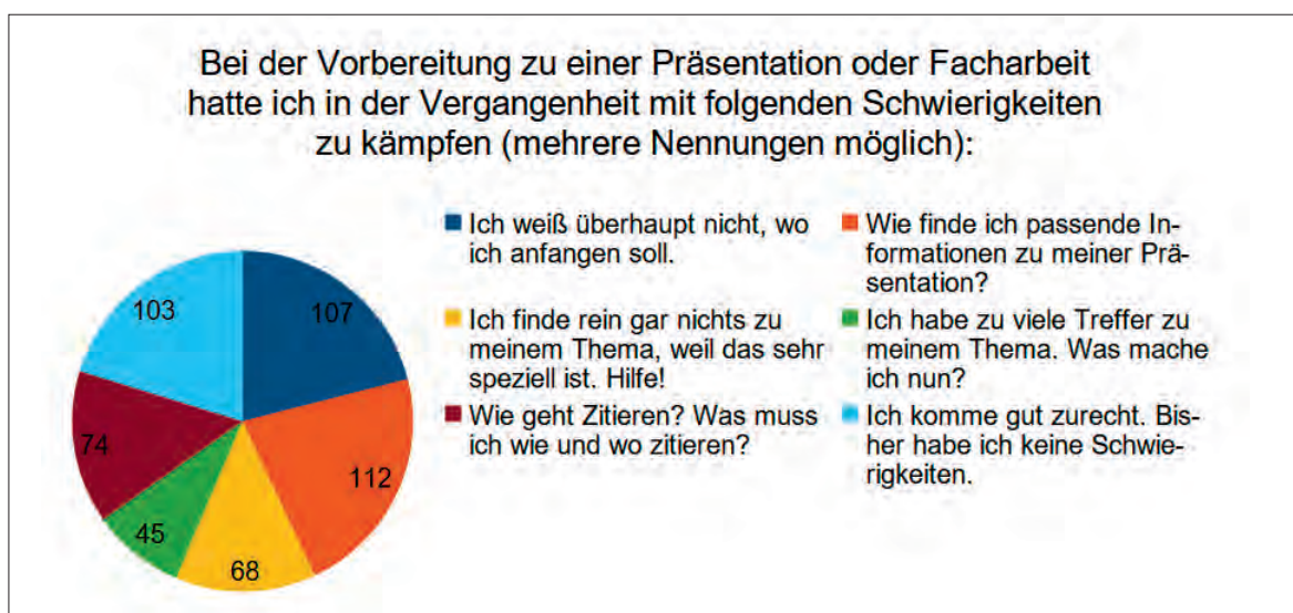
Abb. 4: Frage 8 des Fragebogens für Schülerinnen und Schüler 2021/22

Die ursprüngliche Projektgruppe bestand aus drei Personen. Die große Nachfrage, insbesondere während der Hochphasen der Pandemie, führte dazu, dass weitere Kolleginnen und Kollegen hinzugezogen wurden. Dafür wurde ein mehrstufiges Schulungsmodell aufgesetzt: Im ersten Schritt wird hospitiert, um eine genaue Vorstellung des Formats zu bekommen. Darauf folgt ein Testdurchlauf, bei dem eine Daten-