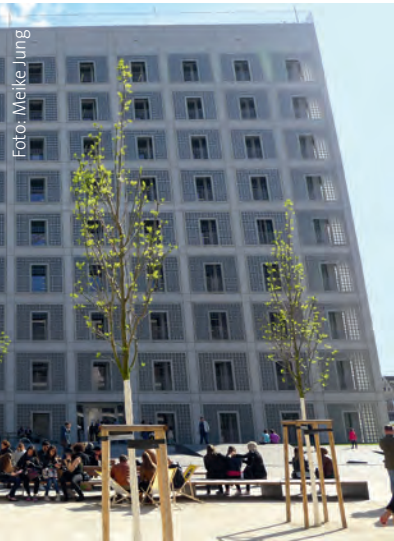
Stadtbibliothek Stuttgart (yi architects)

Professor Eun Young Yi hält heute Abend bei der Eröffnungsfeier die Festrede. Er gewann 1999 den Wettbewerb für den Bau der Stuttgarter Stadtbibliothek am Mailänder Platz. Sein Konzept für den Neubau „orientiert sich an der Idee, mit der Stadtbibliothek in Stuttgart ein neues geistiges und kulturelles Zentrum zu schaffen“ 1 . Der Architekt rückt die Bibliothek in den Mittelpunkt einer modernen Stadt. Er ist überzeugt, dort wo früher Kirchen oder Paläste im Zentrum standen, sollte in einer modernen Gesellschaft die Bibliothek stehen.