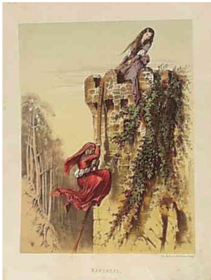
Rapunzel-Bilderbogen im Bestand des Spielzeugmuseums Nürnberg, gefunden über eine Suche in der europeana