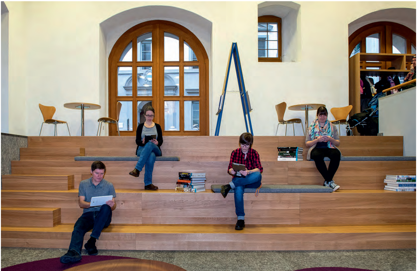
Abb. 4 Mobiler Zugriff auf Curia und Arena

dass diese Kombination auch nach mehrwöchigen Tests und Anpassungen im Detail nicht so funktionierte, dass sie den Qualitätsansprüchen der Bibliothek Zug genügt hätte: Hintergrund war hier, dass nicht alle bibliographischen Details der nach eigenen Hausregeln erfassten Katalogdaten im UNIMARC-Format in Arena vollständig abgebildet werden konnten und die Suche dementsprechend lückenhafte Trefferlisten produzierte. Der Aufwand für die BIBDIA/Arena-Kombination schien zunehmend ein Ausmaß anzunehmen, welches sich für eine Lösung nicht rechtfertigen ließ, die ohnehin nur einige Monate in Betrieb sein würde. Deshalb wurde im November entschieden, stattdessen die Migration von BIBDIA zu Curia voranzutreiben und Arena erst in Kombination mit dem neuen LMS in Betrieb zu nehmen.