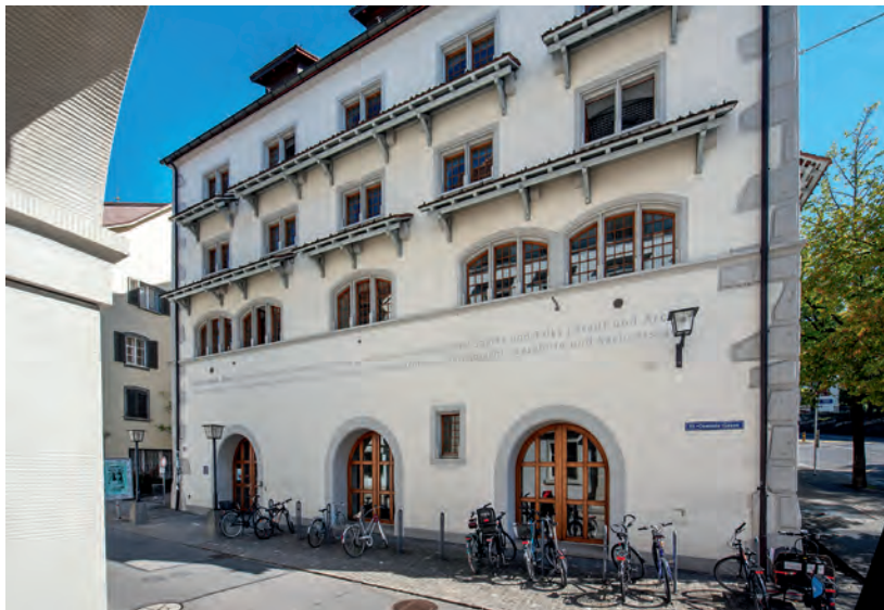
Abb. 1 Bibliothek Zug

Das offizielle Projekt zur Evaluation und Auswahl eines neuen LMS startete im September 2017 mit einem Workshop, in dem Mitarbeitende der Bibliothek Zug zusammen mit zwei externen Expert/-innen Anforderungen an das zukünftige Bibliothekssystem definierten. Daraus resultierend wurden anschließend in Zusammenarbeit mit der Abteilung Informatik der Stadt Zug ein Pflichtenheft und ein Anforderungskatalog sowie alle weiteren erforderlichen Dokumente für die Ausschreibung erstellt. Angesichts der budgetierten Projektkosten erfolgte die Ausschreibung im Einladungsverfahren, wobei fünf verschiedene Anbieter angeschrieben wurden. Drei dieser Firmen unterbreiteten der Bibliothek Zug schlussendlich eine Offerte und wurden für Produktpräsentationen nach Zug eingeladen. Gleichzeitig fanden Referenzbesu-