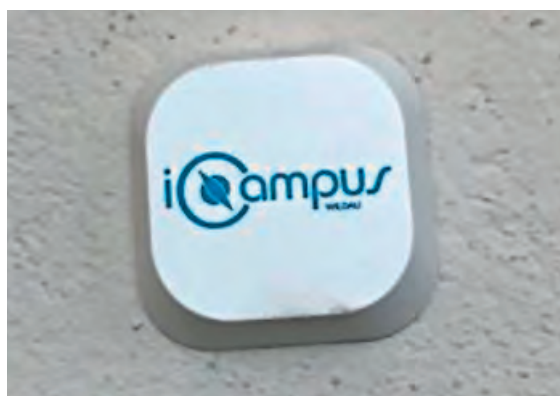
Abb 1: Beacon des ICampus Wildau. Eigene Darstellung

Seit Juli 2016 ist dort die Navigation durch die Bibliothek der technischen Hochschule Wildau mit der Hochschul-App Unidos Wildau und den im Gebäude installierten Beacons möglich. Das Angebot wurde in die App integriert und mit dem Open Source und Open Hardware System OpenBeacon der Firma Bitmanufaktur GmbH erstellt (s. Abb. 1).