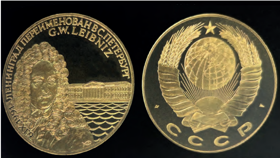
Gedenkmünze anlässlich der Umbenennung von Leningrad in St. Petersburg im Jahre 1991. Auf der Vorderseite Leibniz im Portrait vor der 1724 von Peter dem Großen am Ufer der Newa gegründeten Russischen Akademie der Wissenschaften, die seit 1934 ihren Sitz in Moskau hat.

Octavia ist. Das Werk erschien zunächst in drei Bänden, denen weitere Ergänzungsbände folgten. Beim Tode Anton Ulrichs blieb es jedoch unvollendet. Erst 1762 erschien posthum ein siebenter Band. Zu der von Leibniz erhofften „Entknötung“ oder Entwirrung der komplexen Handlung hin zu einem guten Ende kam es nicht mehr.