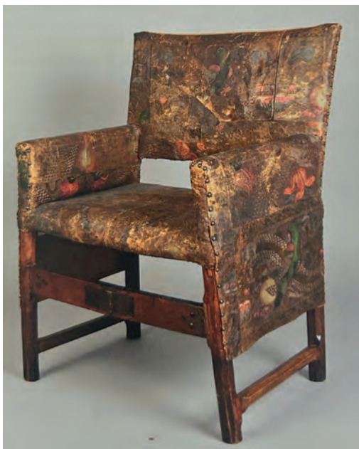
Leibniz' klappbarer Reisestuhl: Original in der Gottfried Wilhelm Leibniz Bibliothek

Auf seinen Reisen von und nach Hannover fuhr Leibniz mit einer eigenen Kutsche und eigenen Pferden. Dabei bestand für ihn die Wahl zwischen einer Route über Bettmar und Peine oder über Hildesheim und Bleckenstedt. Auch die Reisen in der Kutsche nutzte Leibniz zum Arbeiten. So überlegte er sich während der Fahrt zu den Geburtstagsfeierlichkeiten für Herzog Anton Ulrich am 14. Oktober 1695 einen Sinnspruch für eine Medaille mit seiner Rechenmaschine, der Machina arithmetica , und setzte die Notiz hinzu: „Excogitata in curru inter Hanoveram et Peinam 14. Octobr. 1695“ (Ausgedacht auf der Fahrt zwischen Hannover und Peine am 14. Oktober 1695).