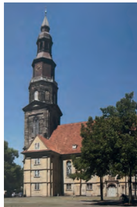
Ev. luth. Neustädter Hof- und Stadtkirche St. Johannis in Hannover.

Mit der nach 1700 zunehmenden Präsenz von Leibniz in Berlin ging die Zahl seiner Besuche in Wolfenbüttel zurück. Dennoch blieb sein Verhältnis zu Anton Ulrich stets freundlich, und der Tod des Herzogs im Jahre 1714 berührte Leibniz tief. Wie er selbst feststellte, war er damals nicht imstande, andere zu trösten, da er den Trost selbst nötig habe. I