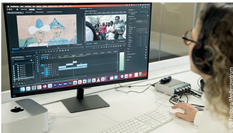
Arbeit am Schnittplatz

Seit 2018 bietet das Fach Pharmazeutische Wissenschaften in der Profillinie Master of Science Regulatory Affairs & Drug Development seinen Studierenden die Möglichkeit, „Fachwissen im Bereich der Arzneimittelentwicklung“ zu erlangen „sowie Anforderungen der Arzneimittel- und Medizinprodukte-Zulassung“ 24 kennenzulernen. Da in diesen Tätigkeitsbereichen auch ein professioneller Umgang mit den Medien wichtig ist, schult das Medienzentrum in einem Semesterkurs die Studierenden in unterschiedlichen Szenarien vor der Kamera und vermittelt Einblicke in die Funktionsweisen des crossmedialen Journalismus und der einzelnen Sparten Fernsehen, Radio, Online. Die Analyse internationaler Videoclips der