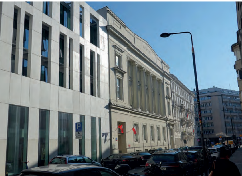
Öffentliche Bibliothek Warschau an der Koszykowa-Straße, Außenansicht neuer und alter Teil der Bibliothek

Die Öffentliche Bibliothek der Hauptstadt Warschau und Hauptbibliothek der Woiwodschaft Masowien (polnisch: Biblioteka Publiczna m.st. Warszawy – Biblioteka Główna Województwa Mazowieckiego) ist eine traditionsreiche Bibliothek, die den Warschauerinnen und Warschauern, umgangssprachlich besser als Bibliothek an der Koszykowa-Straße (Biblioteka na Koszykowej) bekannt ist. Die Bibliothek liegt abseits der Hauptachsen der Stadt Warschau in einer Seitenstraße neben dem Platz der Verfassung (Plac Konstytucji). Als ausländischer Besucher der Stadt Warschau würde man am neoklassizistischen Gebäude mit seinem modernen Gebäudeteil mit der großen Glasfassade vermutlich achtlos vorbeischlendern und es für ein Büro- oder Verwaltungsgebäude halten. Warschauerinnen und Warschauern hingegen ist das Gebäude sehr wohl ein Begriff und gehört zu den festen, im Bewusstsein der Stadt verankerten Institutionen. Die Bibliothek wurde 1907 auf Initiative aus der Gesellschaft als moderne Bibliothek für die Wissenschaft wie auch für die Bewohner Warschaus als Öffentliche Bibliothek gegründet. Ihr erster Direktor war Faustyn Czerwijowski, der die Bibliothek bis 1937 leitete. Die