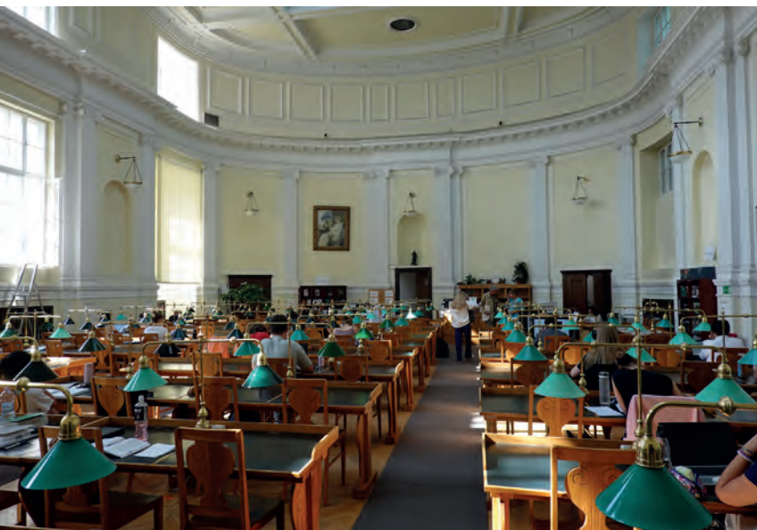
Der Lesesaal im alten Gebäude- teil