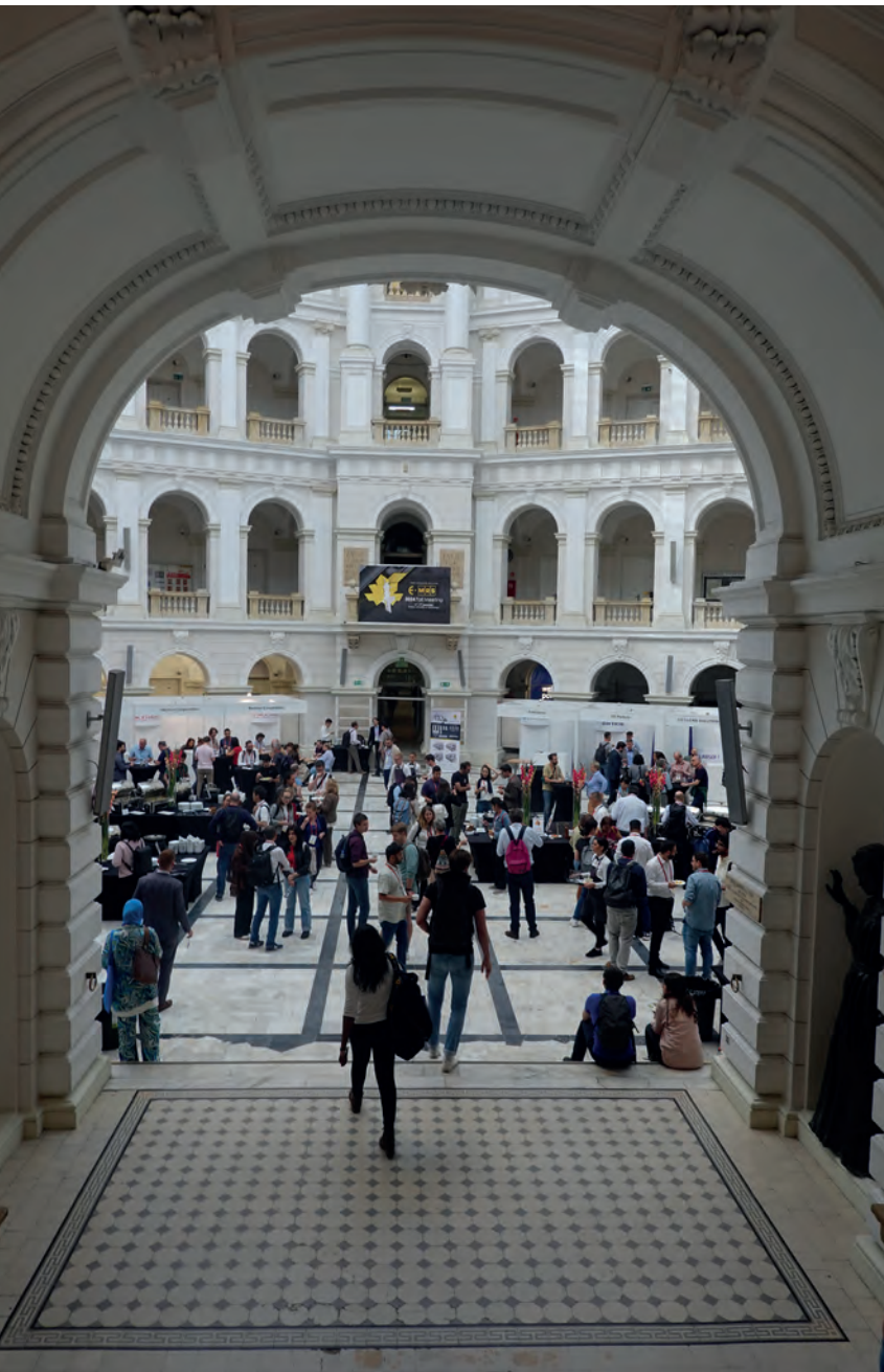
Der Innenhof der Technischen Universität Warschau

außerhalb der Universitäten und in kleineren Städten als den drei vorher genannten Universitätsorten angeboten. Waren die Studienpläne anfänglich noch auf die klassische Bibliothekswissenschaft ausgerichtet, sollte sich dies nun ändern. Die Veränderungen in der bibliothekarischen Ausbildung in den westlichen Ländern, die sich auch in der Tätigkeit der International Federation of Library Associations and Institutions (IFLA) widerspiegelte, veranlassten das polnische Ministerium für Wissenschaft, Hochschulbildung und Technologie, eine Arbeitsgruppe mit etwa einem Dutzend Mitgliedern zu ernennen, die einen neuen Lehrplan für die bibliothekarische Ausbildung