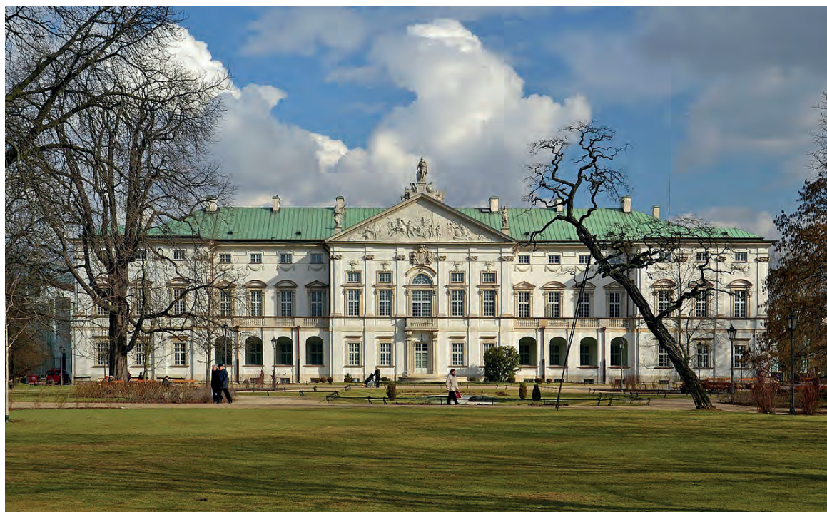
Der historische Krasiński-Palast aus dem 17. Jh., der auch als Palast des polnisch-litauischen Commonwealth bekannt ist, beherbergt die Manuskripte der Polnischen Nationalbibliothek und der ersten gedruckten Bücher.

Allerdings erlitten die polnischen Bibliotheken in Warschau bei der geplanten, aber unvollständig ausgeführten Zerstörung Warschaus nach der Niederschlagung des Zweiten Warschauer Aufstands schließlich das gleiche Schicksal 9 wie zuvor die jüdischen Bibliotheken und Bestände in anderen polnischen Städten. So wurde