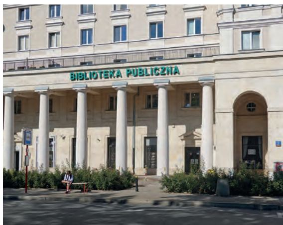
Öffentliche Bibliothek im Stadtteil Muranów, einem Stadtteil Warschaus

der Vernachlässigung bei der Bestandsentwicklung und dem Rückstand bei der Informations- und Kommunikationstechnologie gelitten hatten. Dazu kamen organisatorische und räumliche Probleme, die die Notwendigkeit nach Veränderungen dringend erscheinen ließen. Das bisherige Konzept der wissenschaftlichen Bibliotheken, die hauptsächlich als Aufbewahrungsort für Bücher und Manuskripte dienten, musste an neue Erkenntnisse angepasst werden, um sie von ausschließlich bewahrenden Institutionen zu lernenden Institutionen weiterzuentwickeln, deren Hauptaufgabe der freie Zugang zu Information und Wissen sein sollte. |